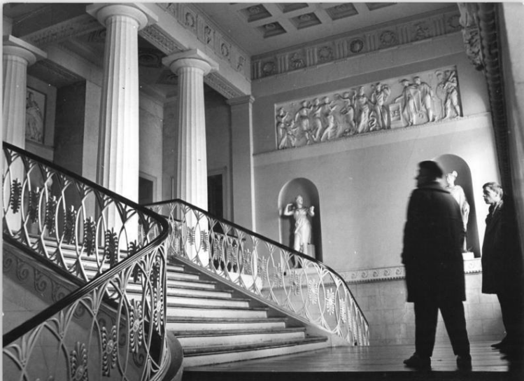
8. Januar 1966

2. KLASSIZISMUS. Erläutern Sie diesen Begriff am Beispiel des Treppenhauses des Weimarer Schlosses!